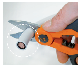
Kabel sauber schneiden bis 70 mm 2