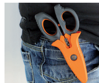
inkl. praktischer Gürtelhalterung