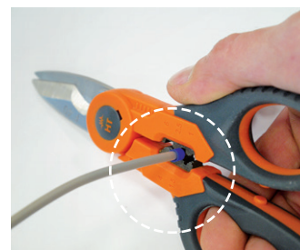
inkl. Crimp-Funktion bis 6 mm 2